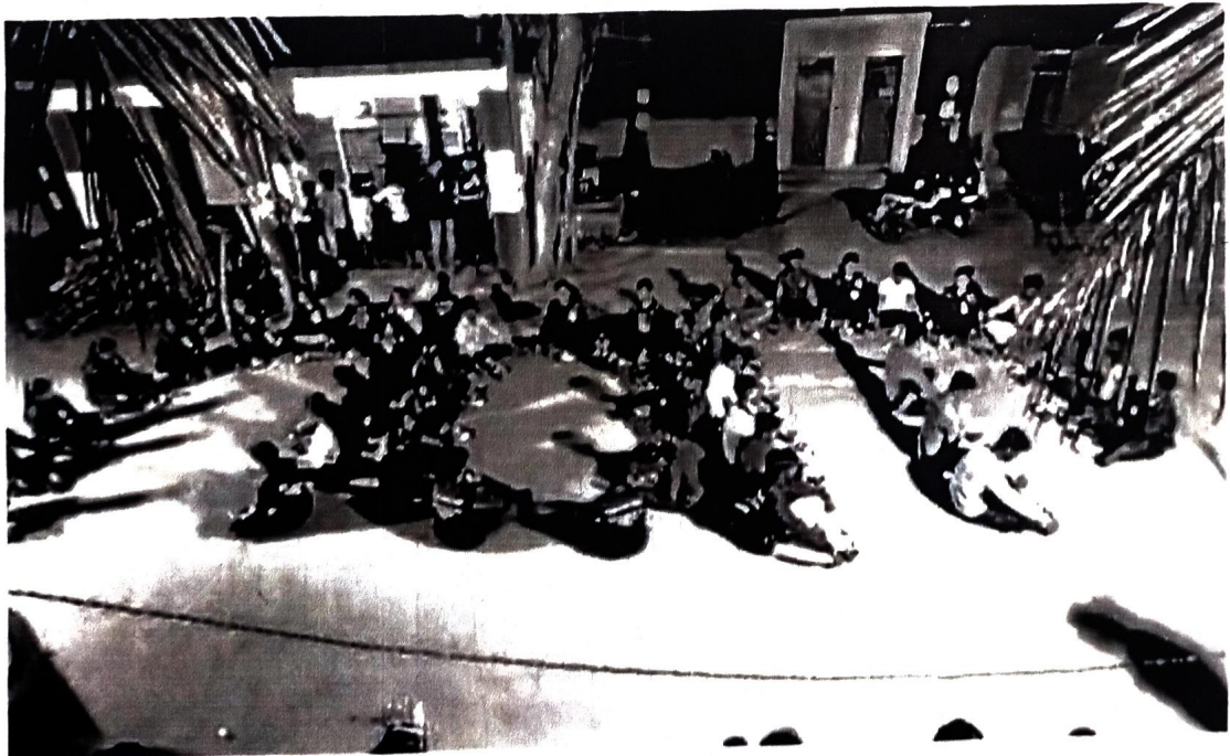
ಪ್ರಯೋಗಶಾಲೆಯಲ್ಲಿ ಜನರ ಮುಕ್ತ ಪ್ರವೇಶಕ್ಕೆ ಸೀಟುಗಳನ್ನು ನೀಡಿದ ವಿಚಾರವನ್ನು.