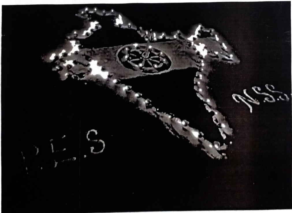
ಶಾಲೆಯ ಜ್ಯೋತಿಷ ಶಿಲ್ಪ.