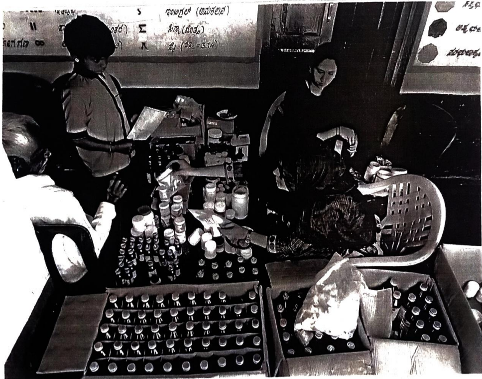
ಶಿಕ್ಷಣದ ಉನ್ನತತೆಯನ್ನು ಉತ್ತೇಜಿಸುವ ಕೆಲಸಗಳು.