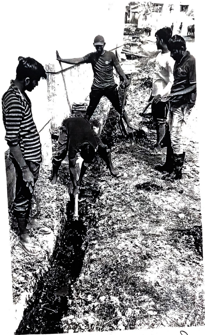
స్వయం సహకార శ్రమ వివరాలు ప్రకారం ప్రకారం.