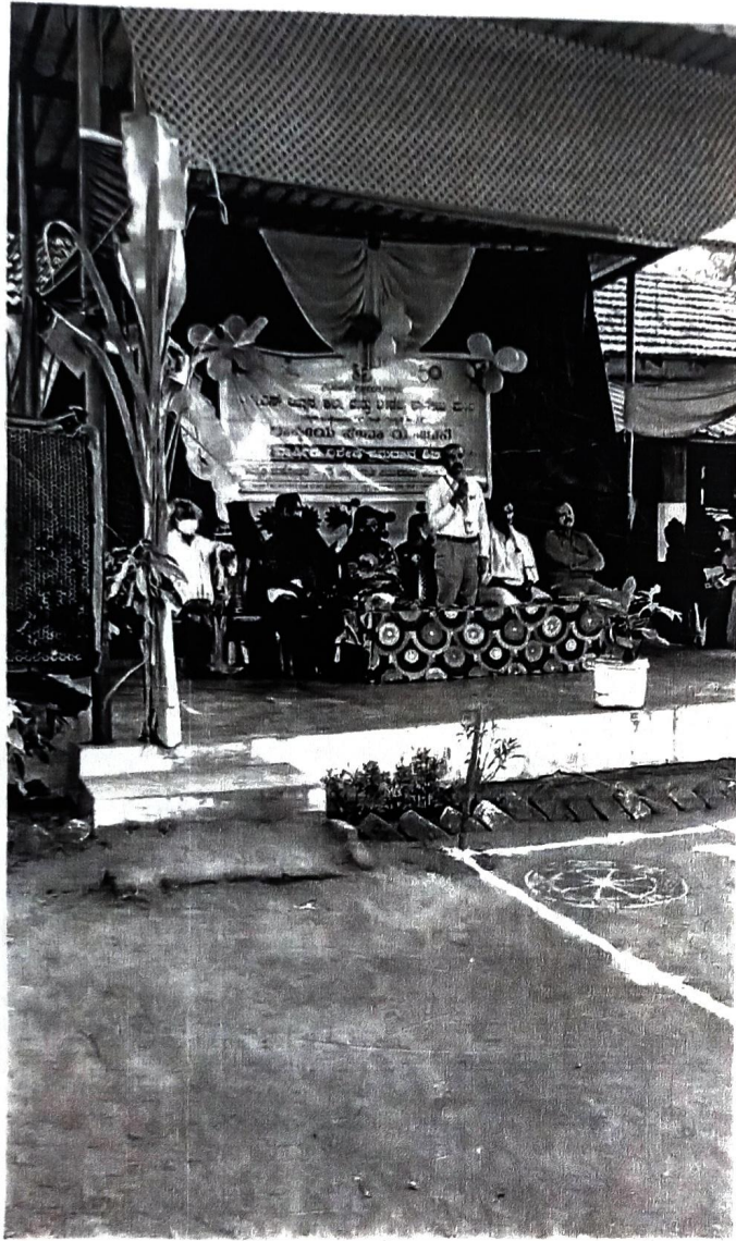
ದಿನಾಂಕ ೨.೧.೨೨ ರಂದು ಪ್ರಾಂಶುಾಲಯದ ಉತ್ಸವದ ಸಂದರ್ಭದಲ್ಲಿ ಪ್ರದರ್ಶನ