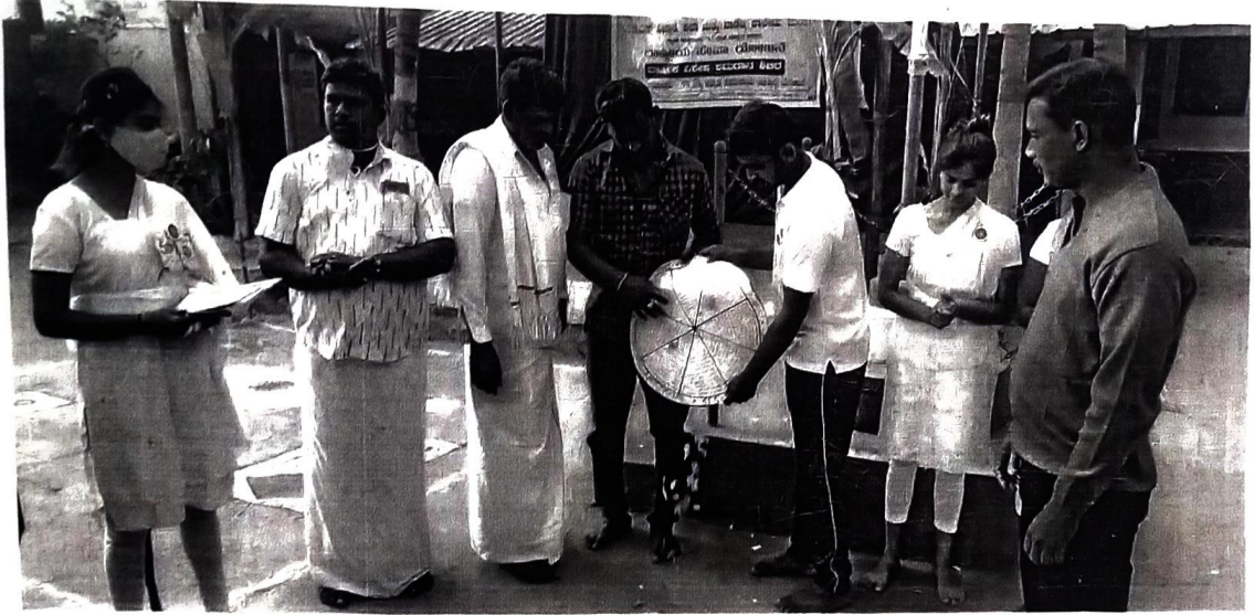
ಶಿಕ್ಷಣದ ಪ್ರಚಾರಕ್ಕಾಗಿ ಕೆ.ಎ. ಸಂಸ್ಥೆಯು ಉಪಯುಕ್ತವಾದ ಉಪಕರಣವನ್ನು ಒದಗಿಸಿ ಮಕ್ಕಳಿಗೆ ಪ್ರಾಥಮಿಕ ಶಿಕ್ಷಣ ನೀಡಿದೆ.