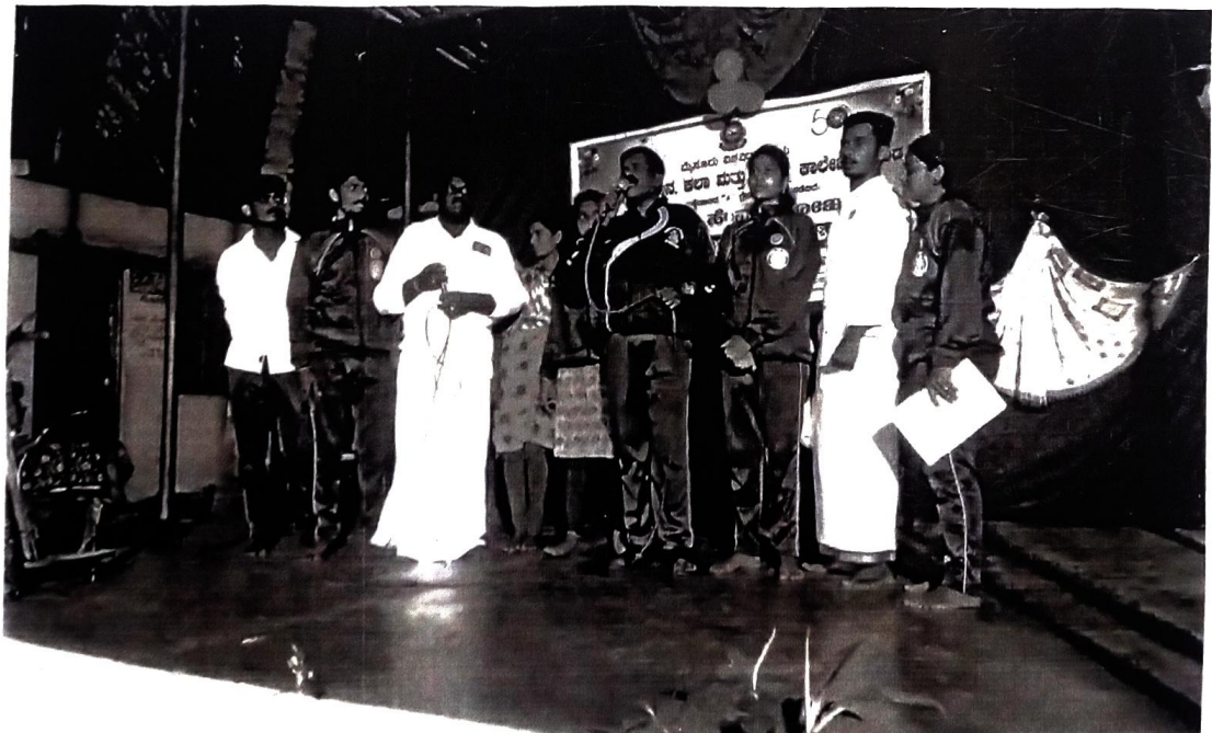
ಕೆ.ಎ. ಸಂಸ್ಥೆಯು ಉಪಯುಕ್ತವಾದ ಉಪಕರಣವನ್ನು ಒದಗಿಸಿ ಮಕ್ಕಳಿಗೆ ಪ್ರಾಥಮಿಕ ಶಿಕ್ಷಣ ನೀಡಿದೆ.