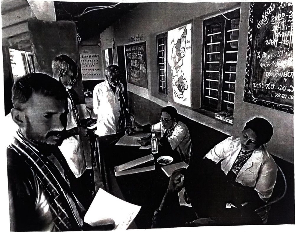
ಆಯುಕ್ತ ಬಲಾಘೋಷಿತರ ಸಕ್ರಿಯತೆಯನ್ನು ಉತ್ತೇಜಿಸಿ ತಿಳುವಳಿಕೆಯನ್ನು ಮೆಚಿರುತ್ತಿರುವುದು.