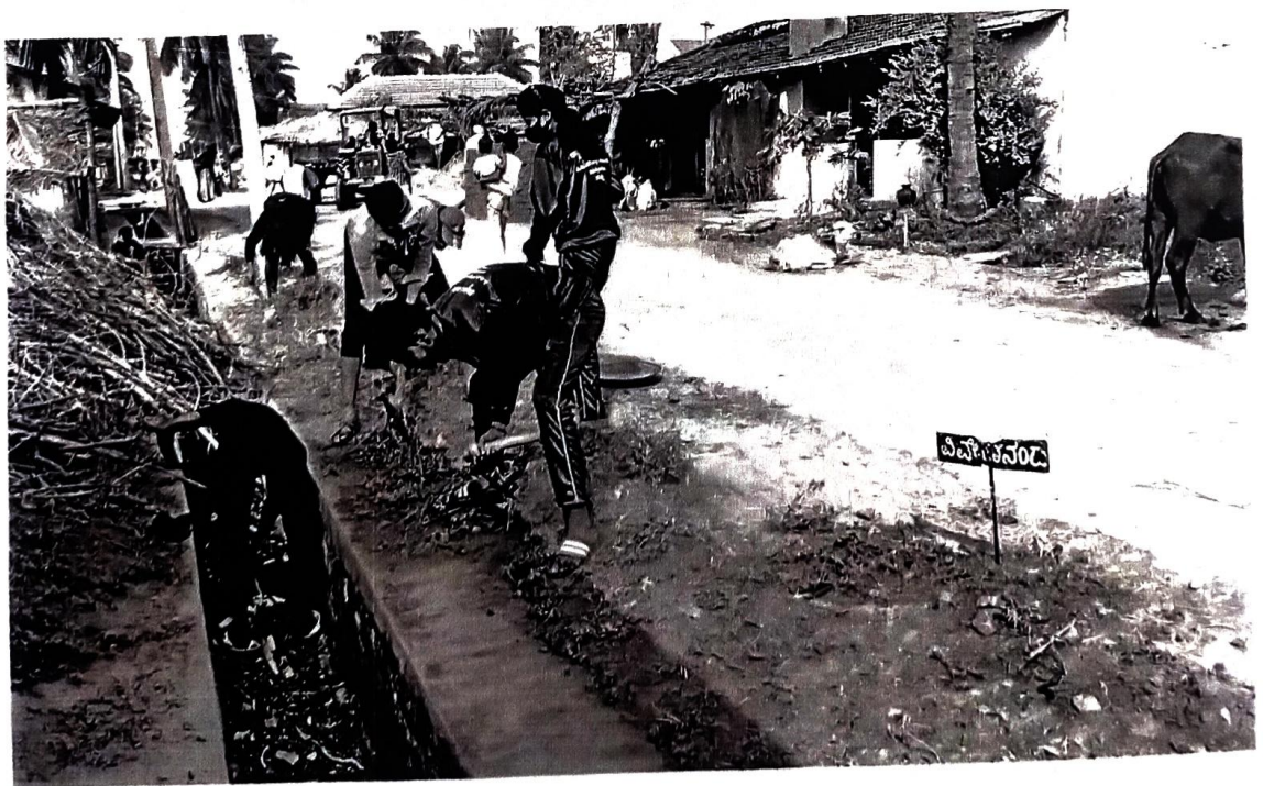
స్వయం సహకార / సహకార యోజనా, శ్రమ వివరాలు ప్రకారం ప్రకారం